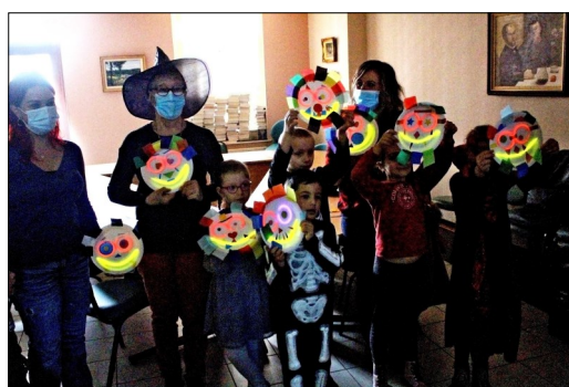
Malle aux histoires du 30 octobre 2021 HALLOWEEN

Prochaine Malle aux Histoires le samedi 18 décembre 2021 à 10h30.