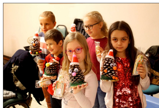
Malle aux histoires du 27 novembre 2021 SAINT-NICOLAS

Attention, Pass sanitaire obligatoire pour l'adulte accompagnant !